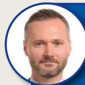
Jarosław Wałęsa | w imieniu grupy EPL

Europosłowie debatowali o przywozie dóbr kultury.